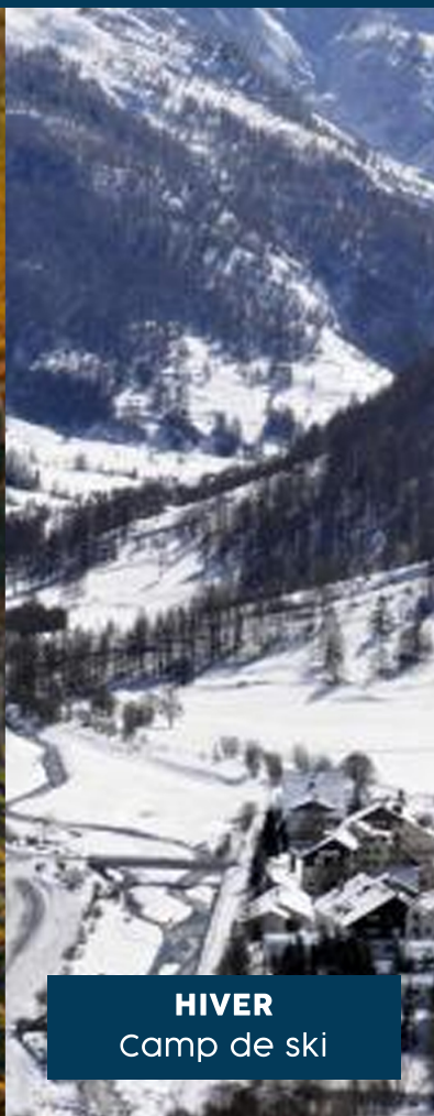
HIVER Camp de ski