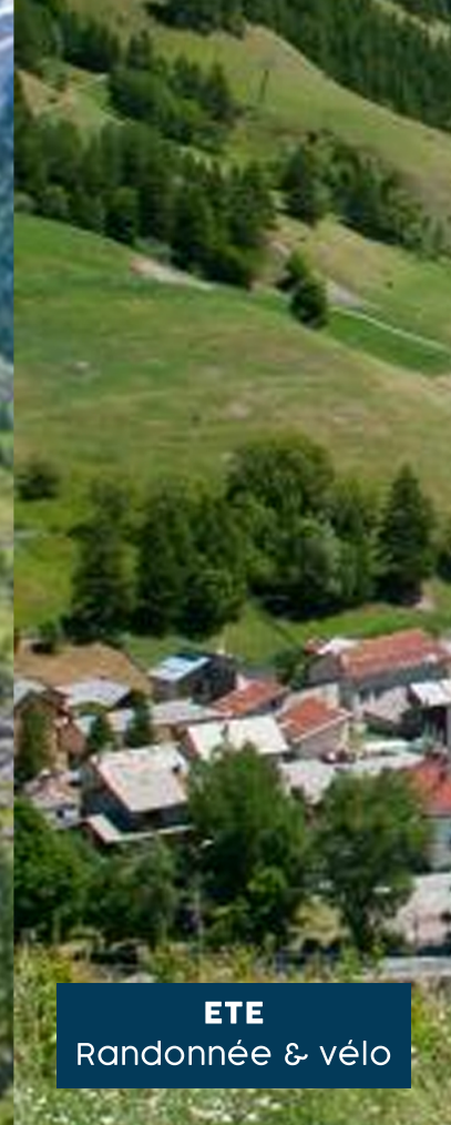
ETE Randonnée & vélo

Le Chalet Chevreul à Ristolas, dans le Queyras, accueille depuis plus de 60 ans les élèves de primaire, collège et lycée.