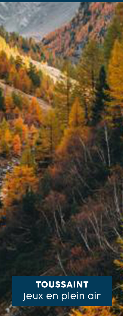
TOUSSAINT Jeux en plein air